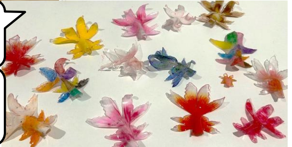
創作活動 ドリーム キャッチャー