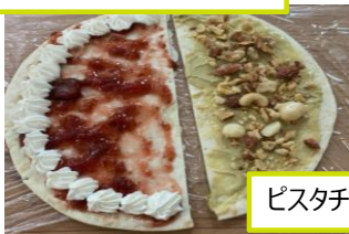
ピスタチオクリームナッツピザ