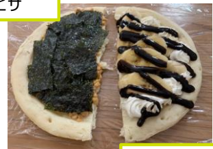
チョコバナナピザ