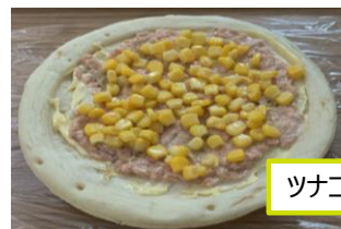
ツナコーンマヨピザ